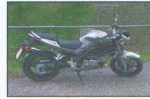
BMW GS 650 mit ABS Mit tiefem Fahrwerk

Unsere Ausbildungsfahrzeuge für KI A, A beschränkt, A1, M Suzuki SV 650 N mit ABS