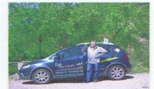
Ab Januar 2009 der neue Golf VI Mit Parkassistent

Moderne Fahrzeuge für eine sichere Ausbildung KI B, BE