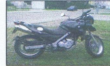
Suzuki DR 125 SM